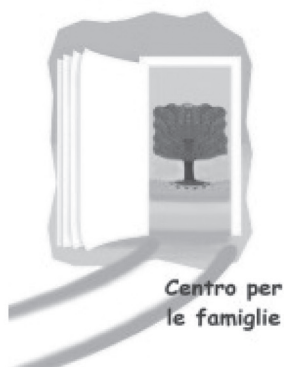
Centro per le famiglie

Sportello di ascolto per genitori separati che offre gratuitamente consulenza psicologica e sostegno